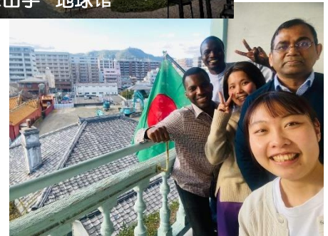
与地球馆的朋友们一起！ (照片右前方为青柳女士)