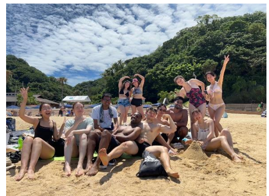
海洋日在伊王岛的照片

现在除了继续开展英语会话讲座、桥牌（使用扑克牌的牌类游戏）等活动外，每月还会举办一次世界美食品鉴、音乐会等文化活动。我自己也是从零开始开展国际交流，就像与外国朋友共享每个季节的乐趣那样开始扩大交流的机会。我正在努力学习英语，最近和大家一起在海洋日那天去了伊王岛。我希望（地球馆）今后可以由此发展成任何人都可以不去留学就能体验国际交流·文化的场所（而且是直接连接长崎与世界的场所），成为让外国人有归属感的、可以享受愉快的长崎生活的场所之一。