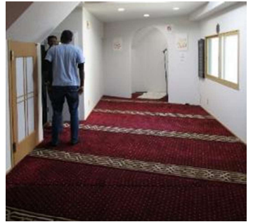
예배실. 매주 금요일에는 30~40명 정도 방문하며, 그 출신국은 35개국 이상입니다.